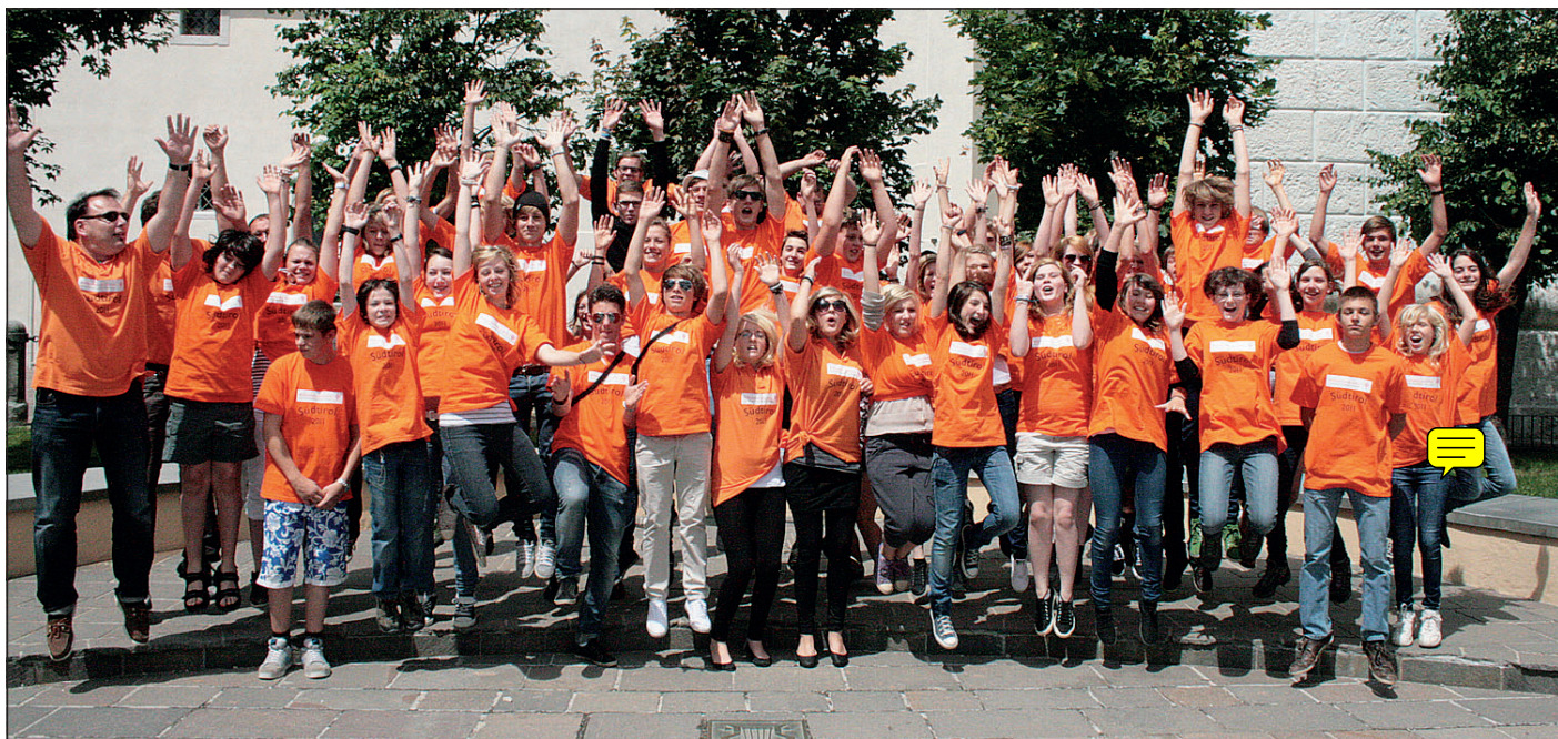
Luftsprung jenseits des Brenners: 52 Jugendliche und Betreuer genießen bis zum 25. Juli die Ferienfreizeit der evangelischen Jugend Bad Fallingbostel in Südtirol.

Für Sonderfahrten ist er über die Soltau-Touristik buchbar. Fahrkarten sind ausschließlich am Sonntag am Zug erhältlich.