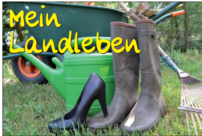
Das Geräusch der Jahreszeit:

Bald ist Wochenende und jeder macht es – da bleibt kein Rasenmäher im Schuppen.